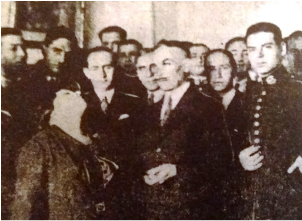
Documents d'archive relatifs aux expériences télépathiques dirigées par Tanagras